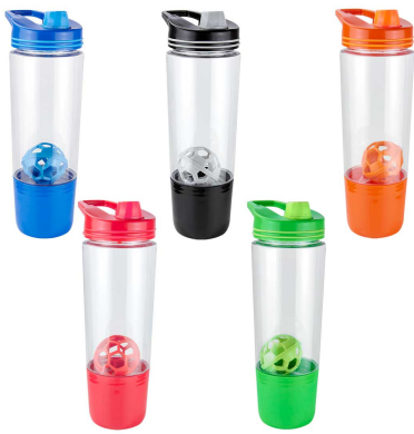
CILINDRO SHAKER OVENS